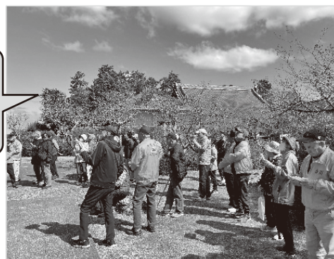
▲ 国分寺の歴史を説明するボランティアガイド