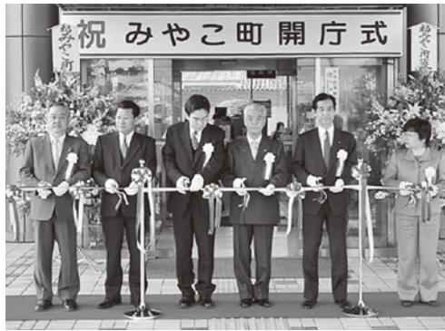
みやこ町開庁式 (平成18年3月20日)

昭和80年(2005)と昭和90年(2015)愛知県で「愛・地球博」が開幕した平成17年(2005)2月に豊津では「小笠原文庫」「豊前国府跡」が県の文化財に指定され、福岡県西方沖地震が発生した3月に勝山、豊津町が町制施行50周年を迎えます。「九州国立博物館」が開館した10月には勝山の「庄屋塚古墳」など5件が町の文化財に指定され、豊津町では「秋月の乱130回忌記念事業」が執り行われました。平成18年(2006)2月、トリノ冬季五輪が開幕し、第1回WBCで日本が初代王者に輝いたこの年、3月に北九州空港が開港し、勝山では「絹本著色当麻曼荼羅図」が県の文化財に指定され「勝山町史」