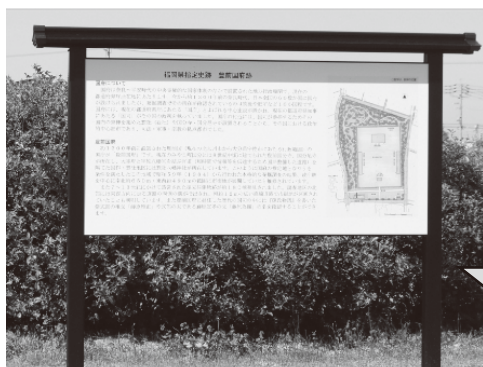
▲ 南側駐車場付近に設置された案内板

3月、町内外から多くの見学者が訪れる「豊前国府跡公園」に設置している説明板2基の更新作業が完了しました。今回の更新作業では、観光庁による英語表記の説明も含まれるなど外国人観光客を対象とした仕様となっています。是非、現地でご覧ください。