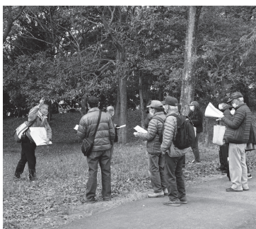
▲歴史講座（みやこ学）での現地見学の様子 最近は近場のウォークが主となっています