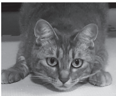
▲「猫の歴史はみやこ町から？」ご来館お待ちしております。

みやこ観光まちづくり協会が実施したフォトコンテストの応募写真（約380点）の展示。