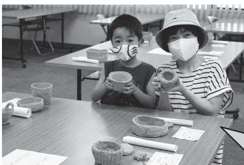
▲焼きあがった土器とご対面！軟らかだった素地がしっかりと世界に一つの「MYうつわ」となってお機嫌の皆さん

8月8日（日）に行われた体験教室「土器をつくろう！」で焼き上げた土器の引渡しが、28日（土）～31日（火）にかけて行われました。期待と不安の入り混じった顔が、帰日には笑顔となっていたのが印象的でした。