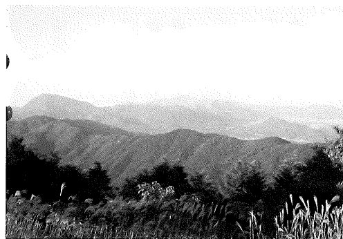
▲大坂山から見る秋峰道ルート(左奥ピークが「龍ヶ鼻」)

ので、春峰(英彦山)〜宝満山(太宰府市)間往復約140キロ)とともに過酷な行として知られ、途中命を落とす山伏もいたと記録されています。