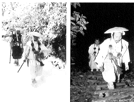
▲大廻行をほうふつとさせる求菩提山の千日行

みやこの山中に残るこの二つの「祈りの山道」は、古人達の求道の姿を知る格好の文化遺産といえそうです。(木村達美)