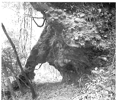
▲大廻道の一部となる蔵持山中の行場・針の耳

その道は「大廻道」と呼ばれ、山中にある数多くの礼拝対象を「廻る行(大廻行と呼ぶ)のためのもので、旧講堂(現祝詞殿)を起点に山の7合目付近をぐる