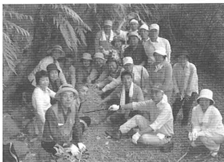
ご利益ツアー① 蔵持山(犀川上高屋)の如意宝珠石の前にて

5月26日と6月2日に当館主催「みやこのご利益ツアー」と題した町内史跡めぐりが行われました。今回は町内で昔から「○○に効く」として知られる信仰対象をめくり、「ありがたーいご利益とは何か」を探ろうという企画です。ツアー①では蔵持山の如意宝珠石を、ツアー②ではお抱え地藏や仙助さん等を見学しました。